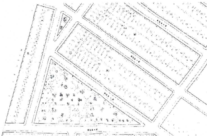
Planta parcial do Loteamento Jardim Alvorada aprovado em 1983.

Conforme identificado no projeto do loteamento, foram destinadas duas áreas triangulares para Praça (área verde) e uma outra área acompanhando a APP, Área de Preservação Permanente, existente no limite do loteamento.