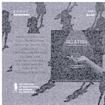
GELATINA (2).png 809K