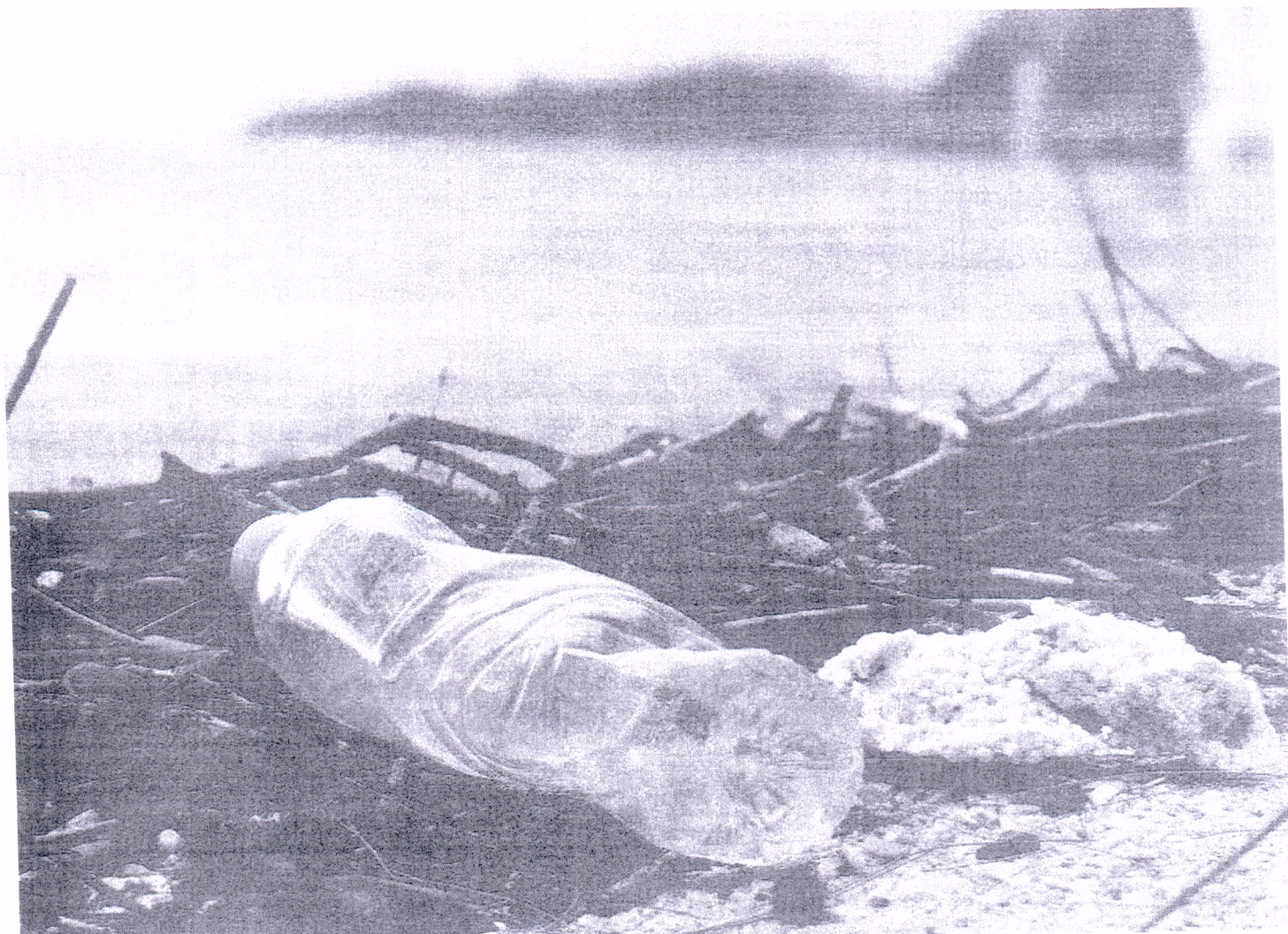
Resíduos variados, descartados de forma inadequada.

O tempo de decomposição dos materiais no meio ambiente é diretamente influenciado por suas características, podendo variar de alguns meses a centenas de milhares de anos .